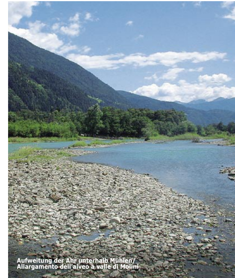
Aufweitung der Ahr unterhalb Mühlen/ Allargamento dell'alveo a valle di Molini

Inserito nel programma Interreg III B, promosso dall'Unione Europea, il progetto „River Basin Agenda“ si propone di coordinare le attività di pianificazione rilevanti per le aree fluviali dei fondivali alpini. La sua realizzazione vede coinvolti 11 fiumi di 6 stati alpini e costituisce un'esperienza di cooperazione esemplare. Per i fiumi modello considerati in Alto Adige, vale a dire "Alto Isarco" e "Basso Aurino", sono in corso progetti dedicati, tra l'altro, alle tematiche della sensibilizzazione e pianificazione coordinata.