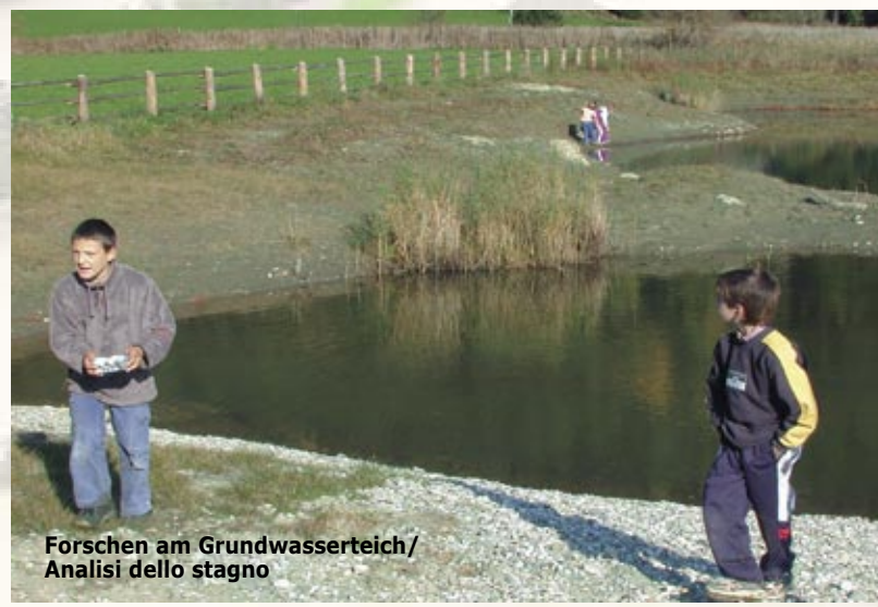
Forschen am Grundwasserteich/ Analisi dello stagno

Solo ciò che si conosce si può anche tutelare. Con l'allestimento di aree ricreative si vuol far sì che le persone si avvicinino al corso d'acqua, imparando a conoscerlo e a viverlo. Ci si attende inoltre che ne siano agevolati gli interventi di difesa dalle piene ed il raggiungimento di obiettivi ecologici. Un primo esempio lo troviamo nell'area ricreativa „Eile“.