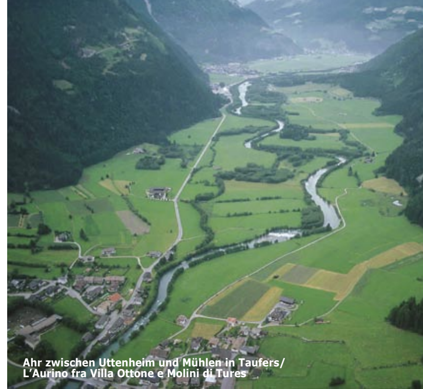
Ahr zwischen Uttenheim und Mühlen in Taufers/ L'Aurino fra Villa Ottone e Molini di Tures