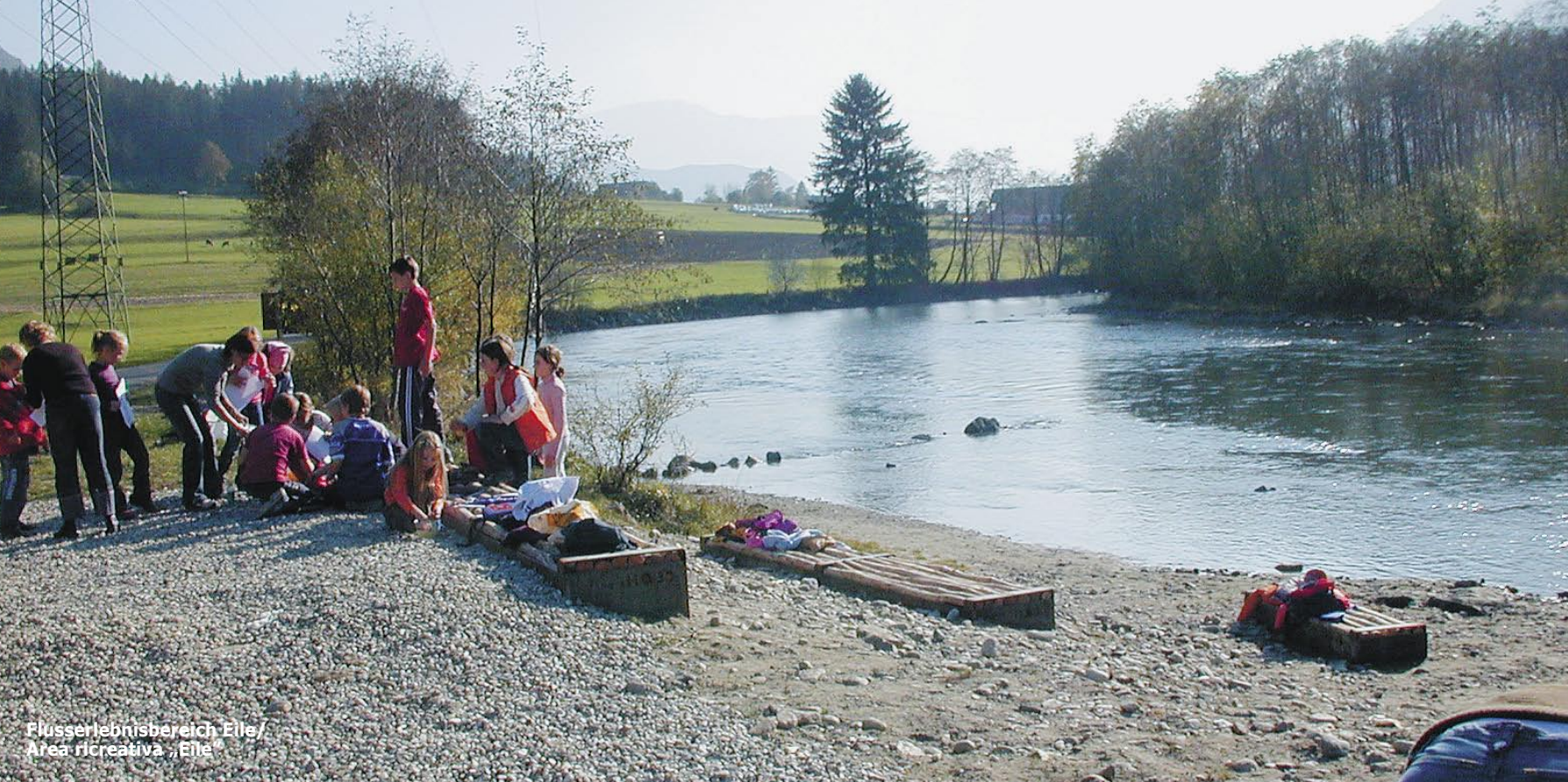
Flusserlebnisbereich Eile/ Area ricreativa „Eile“