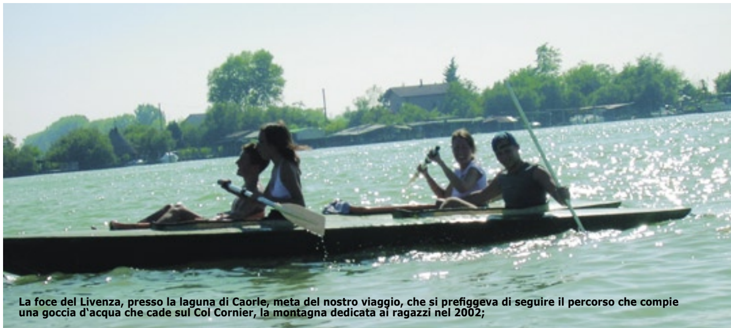
La foce del Livenza, presso la laguna di Caorle, meta del nostro viaggio, che si prefiggeva di seguire il percorso che compie una goccia d'acqua che cade sul Col Cornier, la montagna dedicata ai ragazzi nel 2002;