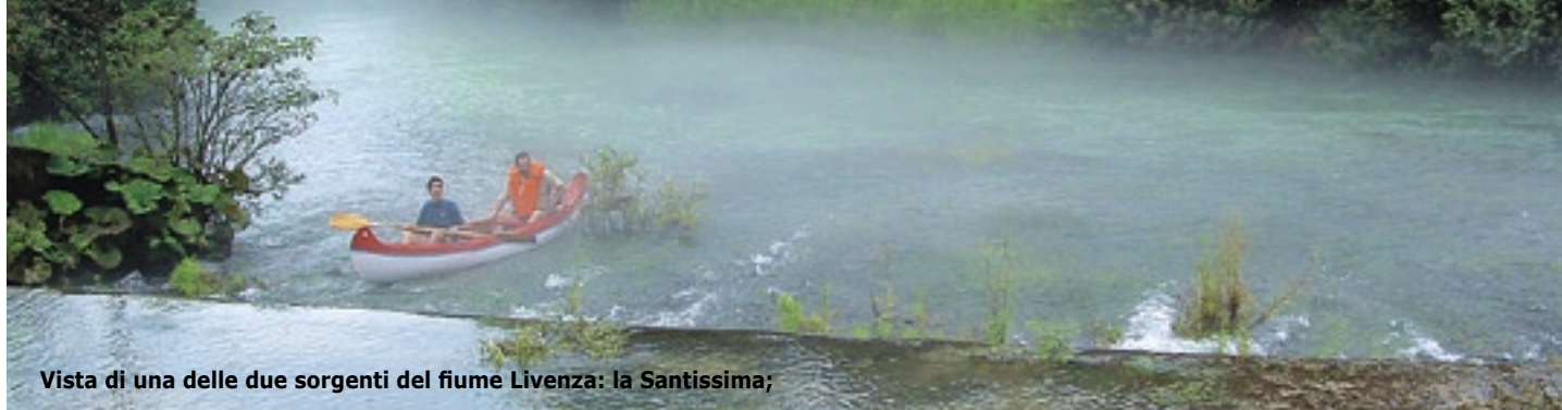
Vista di una delle due sorgenti del fiume Livenza: la Santissima;

Gli atti preparatori del Catasto Austriaco, redatti nel 1826, sono documenti importanti, poiché offrono un quadro della situazione territoriale del primo Ottocento. Dalla lettura di questi documenti, emergono informazioni sui principali elementi dell'economia locale e vengono riportate notizie sullo stato dell'ambiente, boschi, prati, torrenti e quindi l'acqua: „...qui non vi sono riui ne fiumi utili, ma bensì un torrente desolatore che attraversa la Campagna, che si chiama Artugna, il quale col suo corso rapido portano grossi macigni, sassi e giaja, è disalveato e va ad ingerare i terreni adiacenti, li quali portano dani considerabili, la difesa è a carico dei proprietari dei terreni limitrofi... Le acque essendo di un rapido corso perché discendono dall'alto delle montagne l'acqua pluviale, non ha lunga durata. Qui non ve altra acqua solo quelle che servono all'uomo e alle Bestie che si prendono da un piccolo ruscello che discende dalla Montagna ed estrate da molti pocci che esistono qui...”