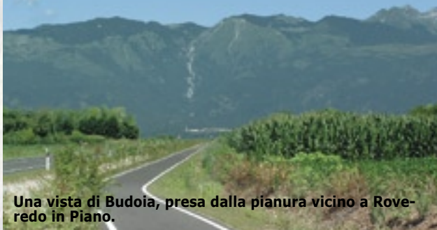
Una vista di Budoia, presa dalla pianura vicino a Roveredo in Piano.

Un progetto nell'ambito del programma Interreg III B-Spazio Alpino