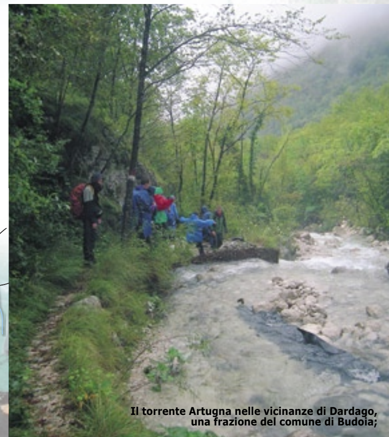
Il torrente Artugna nelle vicinanze di Dardago, una frazione del comune di Budoia;