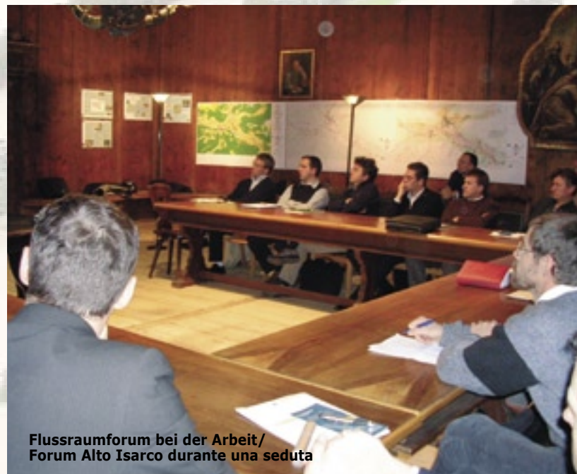
Flussraumforum bei der Arbeit/ Forum Alto Isarco durante una seduta

Ripartizione 30 Opere Idrauliche Abteilung 30 Wasserschutzbauten