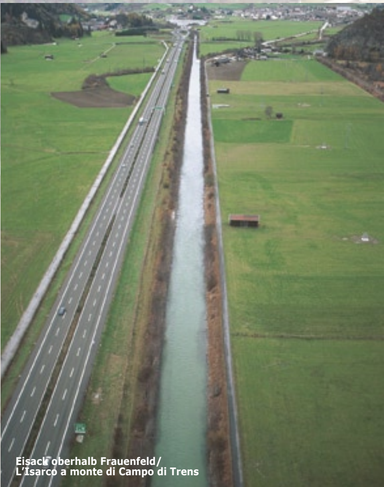
Eisack oberhalb Frauenfeld/ L'Isarco a monte di Campo di Trens