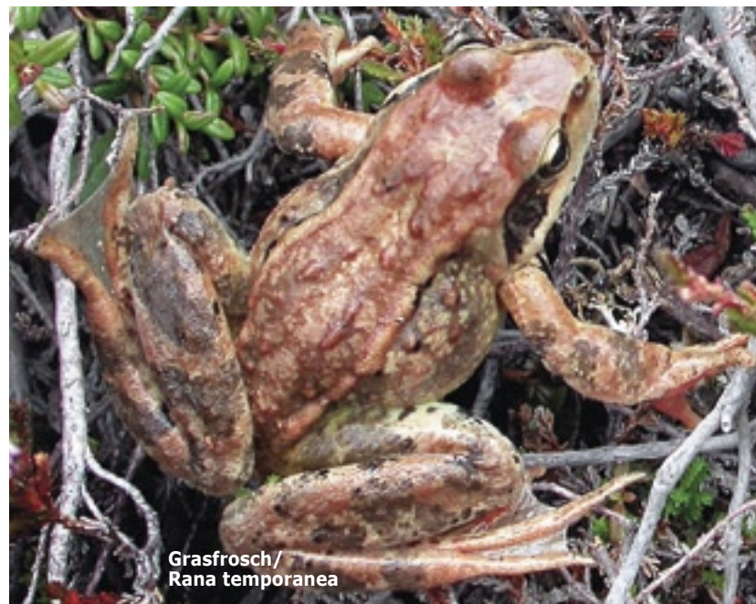
Grasfrosch/ Rana temporanea

Per i fiumi modello considerati in Alto Adige, vale a dire „Alto Isarco“ e „Basso Aurino“, sono in corso progetti dedicati, tra l'altro, alle tematiche della sensibilizzazione e pianificazione coordinata.