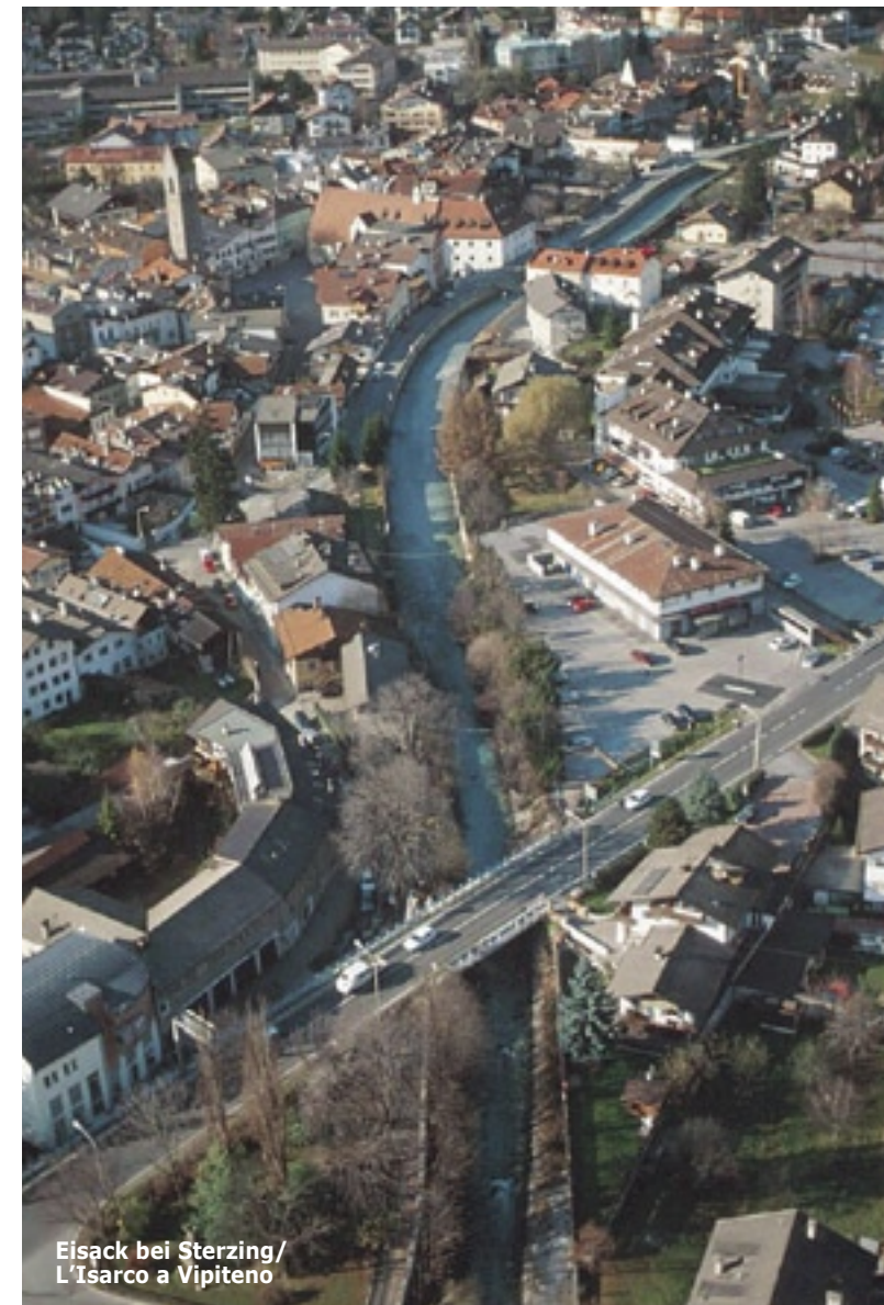
Eisack bei Sterzing/ L'Isarco a Vipiteno

Der Eisack ist der zweitgrößte Fluss Südtirols. Er entspringt im Brennergebiet und mündet nach rund 95 Kilometern unterhalb von Bozen in die Etsch. Projektgebiet im Rahmen der Flussraumagenda ist der Obere Eisack im Sterzinger Becken mit den Zuflüssen Mareiterbach und Pfitscherbach.