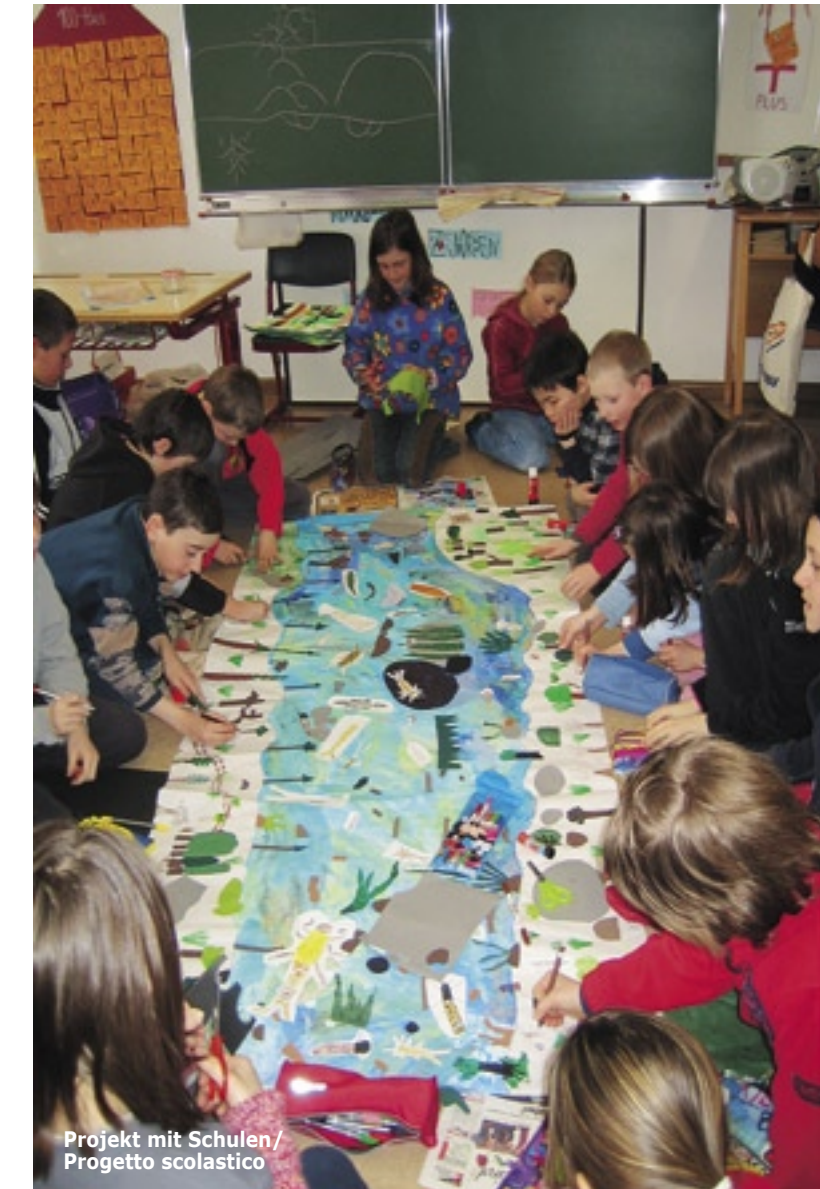
Projekt mit Schulen/ Progetto scolastico

L'Isarco è il secondo fiume dell'Alto Adige. Nasce tra le montagne del Brennero e dopo un corso di ca. 95 km, si versa nell'Adige a sud di Bolzano. L'area di progetto considerata nel contesto della River Basin Agenda è il corso superiore dell'Isarco nel bacino di Vipiteno con i due affluenti Rio Ridanna e Rio Vizze.