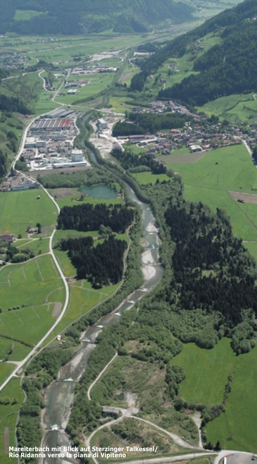
Mareiterbach mit Blick auf Sterzinger Talkessel/ Rio Ridanna verso la piana di Vipiteno