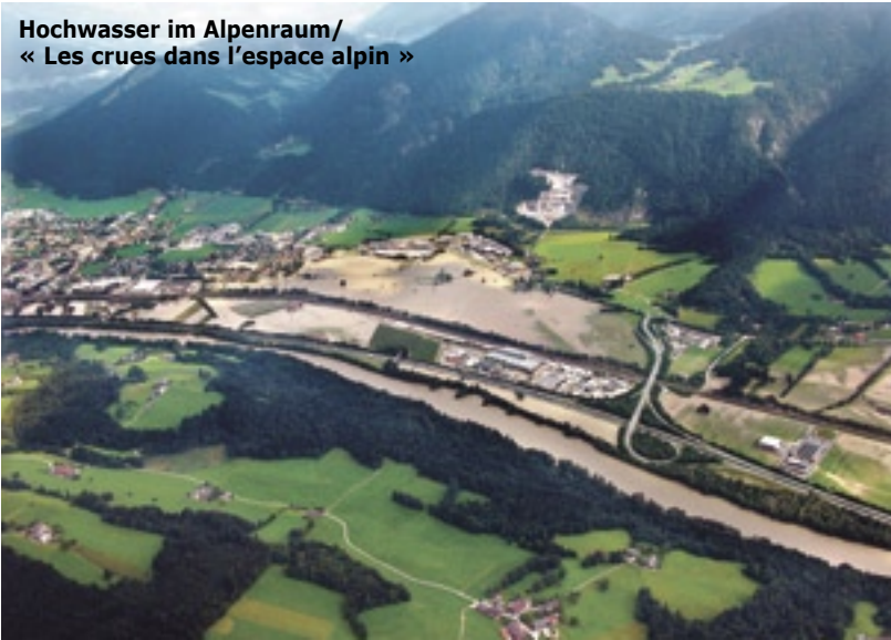
Hochwasser im Alpenraum/ « Les crues dans l'espace alpin »

In dem von der EU geförderten Interreg III B-Projekt „Flussraumagenda für den Alpenraum“ arbeiten Vertreter aus sechs Alpenanrainerstaaten an Strategien zu einem modernen Flussraummanagement. Dieses soll dazu beitragen, die Nutzungsansprüche an den Fluss unter dem Aspekt eines nachhaltigen Hochwasserschutzes zu koordinieren und zu harmonisieren, um das Schadenspotenzial – soweit als möglich – zu begrenzen.