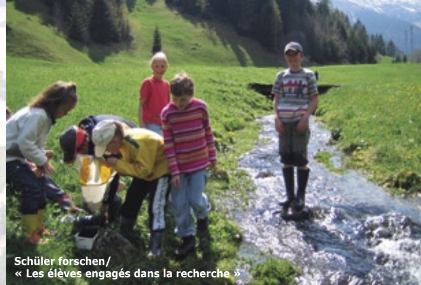
Schüler forschen/ « Les élèves engagés dans la recherche »