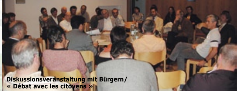
Diskussionsveranstaltung mit Bürgern/ « Débat avec les citoyens »