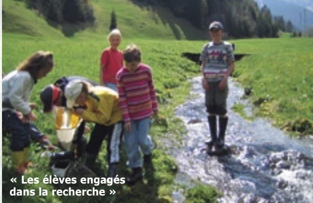
« Les élèves engagés dans la recherche »